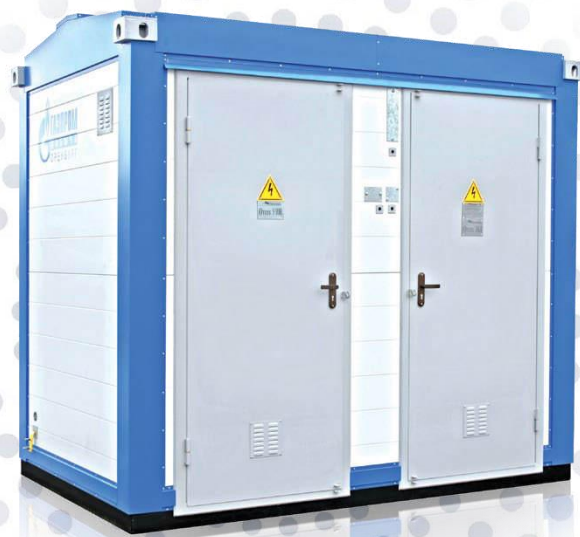
БКУ ЭХЗ «Меркурий-2»

Устройства блочные комплектные электрохимической защиты типа БКУ ЭХЗ «Меркурий-2» предназначены для: приема, преобразования электрической энергии трёхфазного переменного тока частоты 50 Гц напряжением 6(10) кВ; распределения электроэнергии напряжением 0,4 кВ на объектах сбора, транспорта и подготовки нефти и газа; управления и защиты от коррозии подземных сооружений (газопроводов, нефтепроводов, продуктопроводов и др.) и коммуникаций; приема и выдачи сигналов в систему телемеханики о состоянии защищаемых объектов.